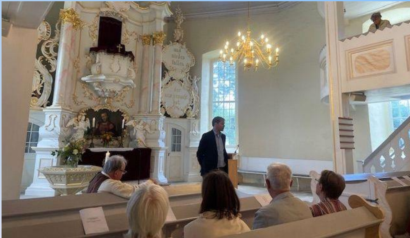
Rückblick auf die Veranstaltung am 24. August 2025 St. Petrikirche in Büßleben